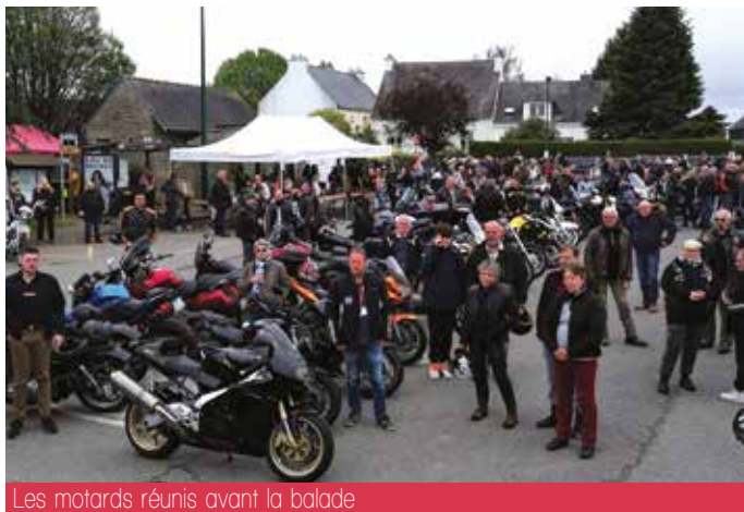
Les motards réunis avant la balade

L'association Motards Solidaires 56 organisait sa première manifestation caritative le dimanche 7 mai. Pari réussi, de nombreuses grosses cylindrées ont investi le centre bourg. La balade a réuni 200 motos, chaque participant reversait 5 € à l'association. Les animations proposées, troc et puces, stands de restauration, prestation du cercle celtique de Port-Louis et bal en fin d'après-midi, ont remporté un vif succès. Tous les bénéfices ont été reversés intégralement à l'association Princesse Maëlys de Locoal-Mendon.