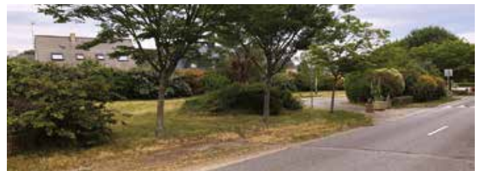
Terrain devant accueillir la future MAM, rue de Merlevenez

Plusieurs parents ont fait part aux élus du manque d'offres pour la garde d'enfants dans la commune. Pour remédier à ce problème, l'équipe municipale a décidé d'implanter une maison d'assistants maternels (MAM) à l'entrée du bourg route de Merlevenez. Cet équipement d'une capacité de 12 places est prévu pour 3 professionnels de la petite enfance. Son coût estimatif est de 483 000 €. Ce projet est subventionnable à hauteur de 30 % par le Département. La caisse d'allocations familiales (CAF) apportera quant à elle 140 000 € pour la réalisation de cette maison. La municipalité espère que la MAM sera opérationnelle au premier semestre 2024.