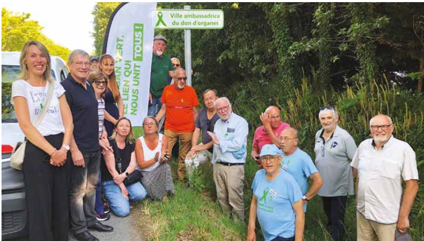
Élus et membres d'associations œuvrant pour la sensibilisation au don d'organes