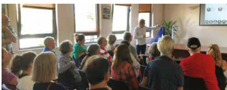
Les nouveaux résidents lors de la présentation de la commune