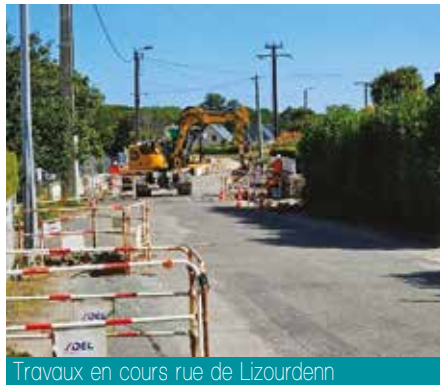
Travaux en cours rue de Lizourdenn

Les travaux ont démarré début juillet et devraient être terminés en octobre.