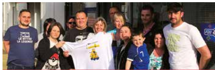
Les membres du club

La commune compte désormais un club de fléchettes. Créée il y a un an, l'association T'Minions vient de transférer son siège au bar-tabac presse Le Napoléon. Elle en a profité pour élire un nouveau bureau. Le club compte 2 équipes qui s'entraînent tous les mardis. En juin prochain, il va participer au championnat de France à Vannes.