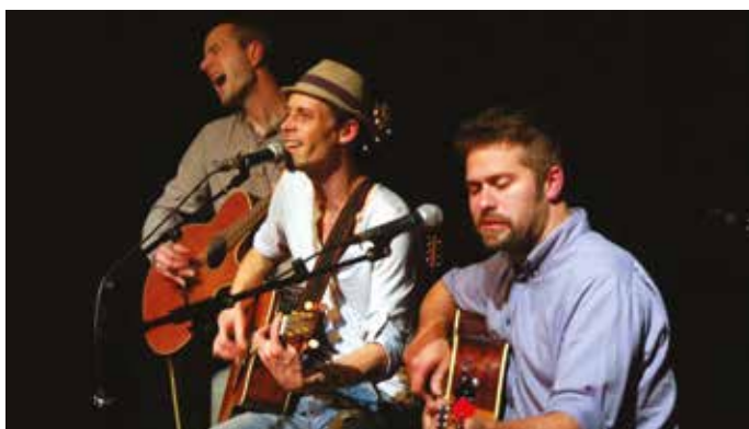
Les Doigts du Cru

Marché d'artisans locaux et concerts en plein air avec RHUM ARRANGÉ et LES DOIGTS DU CRU > À partir de 18h | Gratuit (Festoù)