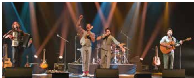
Les Types à Pied

Avec TU M'ADOR et LES TYPES À PIED > À partir de 19h | Gratuit (Festoù)