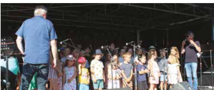
Les enfants des écoles Georges MORIN et Saint-Joseph sur scène

Très belle réussite pour la première fête de la musique organisée par Festoù . Dès 18 h, le public est venu en nombre assister à la prestation des enfants des 2 écoles qui se sont retrouvés sur scène pour interpréter des chants préalablement travaillés en classe. 6 formations musicales se sont succédé durant toute la soirée.