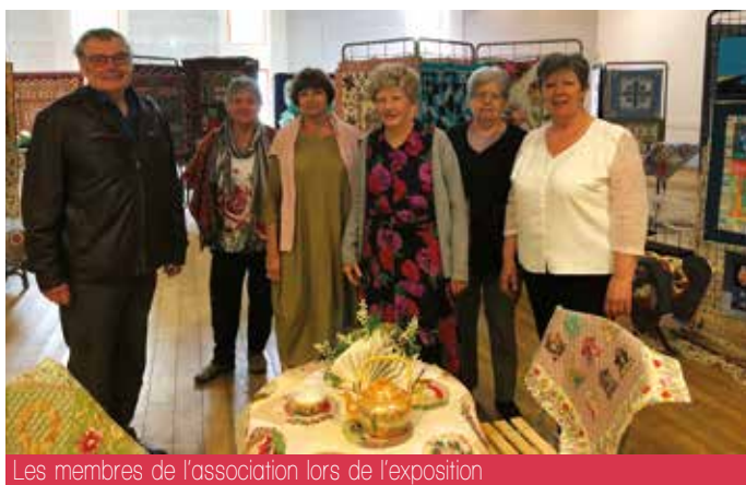
Les membres de l'association lors de l'exposition

> Pour tout renseignement ou pour participer aux ateliers, merci de contacter le 06 48 58 40 81