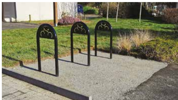
Nouveaux supports vélos à la salle Beg er Lann