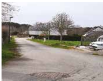
Impasse Georges MORIN