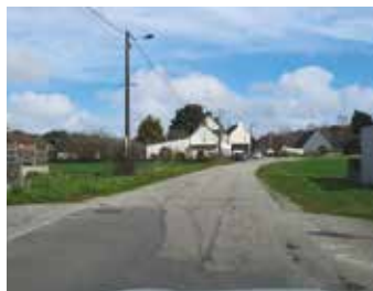
Route du stade près du Clos de la Fontaine