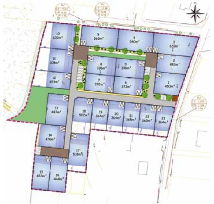
Plan de composition (Échelle 1/500)

Le permis d'aménager du lotissement communal a été validé le 14 février 2022. La consultation des entreprises pour la viabilisation des terrains sera lancée fin avril. Les travaux pourront débuter cet été. Le prix des terrains va être fixé prochainement. Les personnes intéressées pour recevoir le règlement du lotissement et les informations liées à la vente peuvent adresser leurs coordonnées à mairie@sainte-helene-surmer.bzh