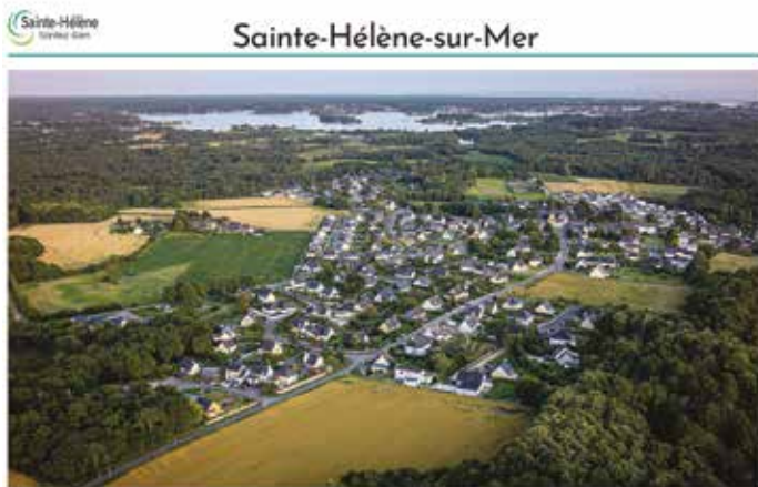
L'un des 10 panneaux installés