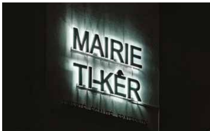
Signalétique bilingue rétro-éclairée sur la Mairie