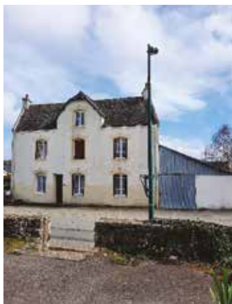
Pose d'une lanterne à l'arrière du mat existant