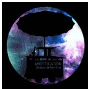
Fabrication de Badges