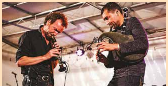
Pasquet / An Habask