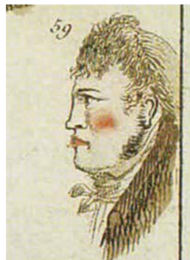
Portrait de Jean ROHU d'après signalement réalisé par la police de Paris vers 1800

Le transfert des corps de l'ancien au nouveau cimetière s'est effectué de 1971 à 1974 avec de nombreuses recherches et relances d'héritiers. Plusieurs concessions ont aujourd'hui disparu comme celle de l'officier Jean ROHU (1771-1849), lieutenant de Georges CADOUAL (1771-1804), ou celle de François LE GOURIFF (1772-1823), capitaine des chouans de Sainte-Hélène-Nostang, dont l'action et le souvenir sont décrits sur l'une des tombes du nouveau cimetière.