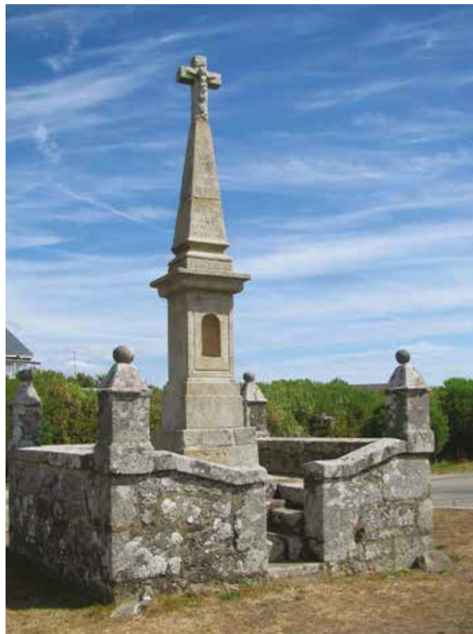
La Croix des Émigrés à Carnac

En 1970, devant l'exiguïté des lieux, la municipalité dû se résoudre à transférer le cimetière du centre-bourg vers un terrain acquis en direction de Mane Kerzerh au lieu-dit Bout-Aval. C'est sur 3600 m 2 clos d'une haie que se répartirent 255 concessions, un ossuaire, un local technique et des places de parking.