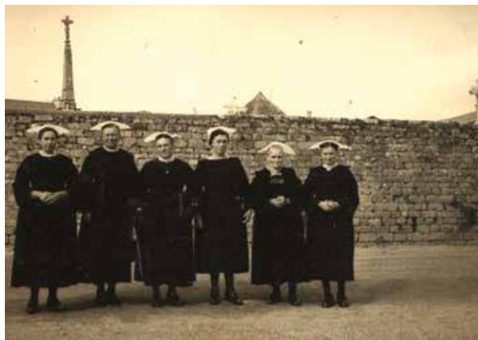
Mur d'enceinte de l'ancien cimetière

Lors de la constitution de la paroisse et de la commune, c'est autour de la chapelle du bourg, anciennement village de Kêr Elena, que les inhumations eurent lieu. Le mur d'enceinte du cimetière occupait pratiquement toute la surface de l'actuel jardin public à l'arrière de l'église.