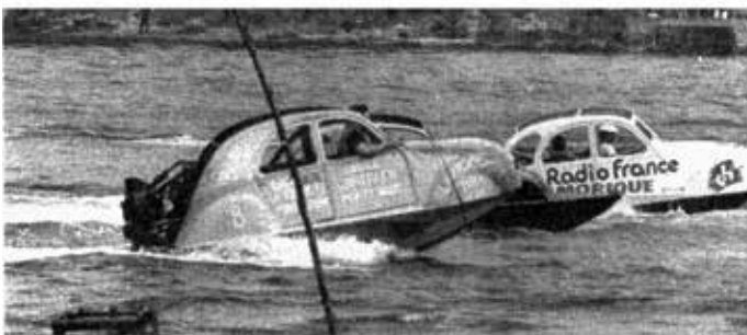
Pour les 2 CV bateaux...

Il ne faut pas oublier non plus ce qui, aux yeux de certains, a pu passer pour le clou de la journée, la course de lits nautiques, où un lit de noces prit le dessus sur un lit à baldaquin un peu trop lourd.