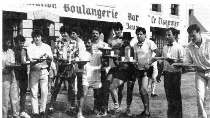
Les garçons de café à l'arrivée.