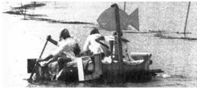
... et les lits flottants.